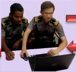
အကောက်ခွန်အရာရှိ

③ အကောက်ခွန်အရာရှိမှ Application Form အားစစ်ဆေးပြီး မှန်ကန်မှုရှိပါက MACCS ထဲသို့ထည့်သွင်းရပါမည်။